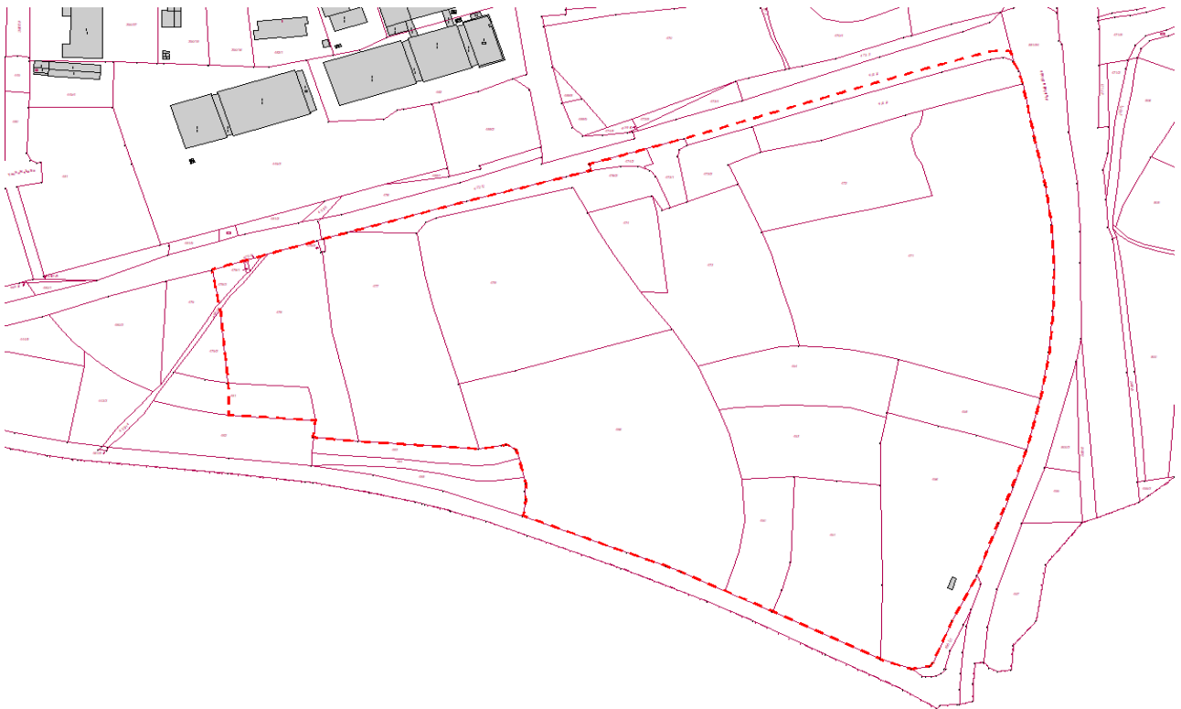
Geltungsbereich mit Rotumrandung Bebauungsplan Nr. 1 „Unterlerchfeld“