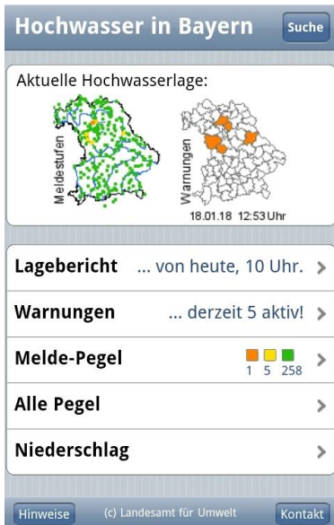
Bild 2: Auf m.hnd.bayern.de/ können Sie sich ganz einfach über die aktuellen Wasserstände in Flüssen informieren.

Bild 1: Das Online-Angebot m.hnd.bayern.de/ bietet alle Hochwasserwarnungen auf einen Blick.