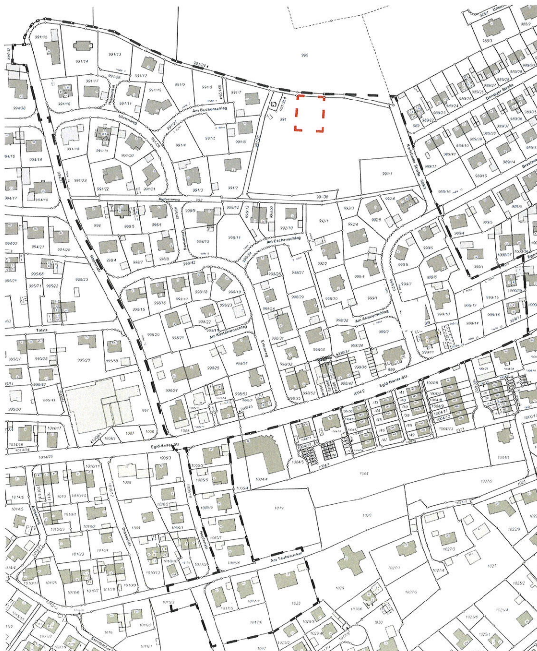
Geltungsbereich Bebauungsplan Nr. 24 „Im Tal“, schwarze Linie Bestand, rote Linie 1. Änderung

Die Änderung erfolgt im beschleunigten Verfahren (§ 13 a i. V. m. § 13 BauGB) ohne die Durchführung einer Umweltprüfung gem. § 2 Abs. 4 BauGB.